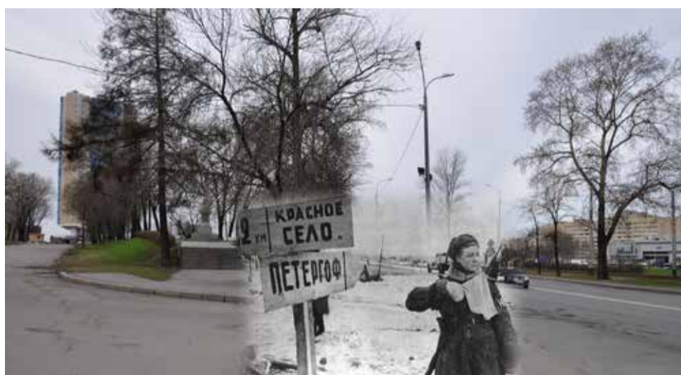
Ленинград 1944–2012. Регулировочница у развилки дорог на Красное Село. Фотоколлаж Сергея Ларенкова

Урицкий рубеж Ленинградского фронта разделял территорию современного