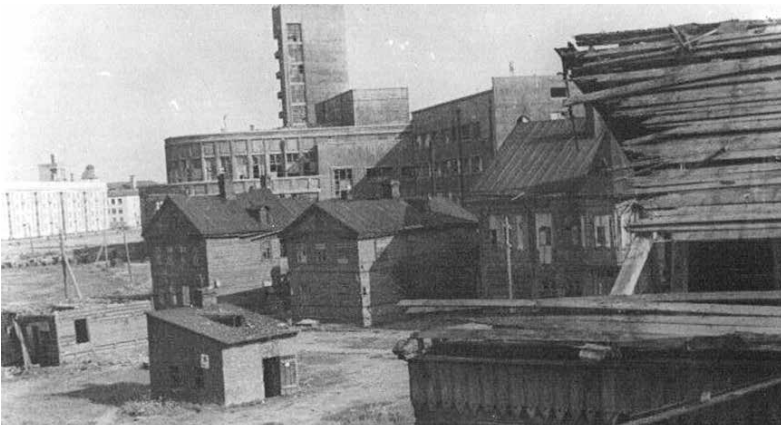
За Нарвской заставой в деревянных домах в начале прошлого века жили семьи рабочих Путиловского завода.