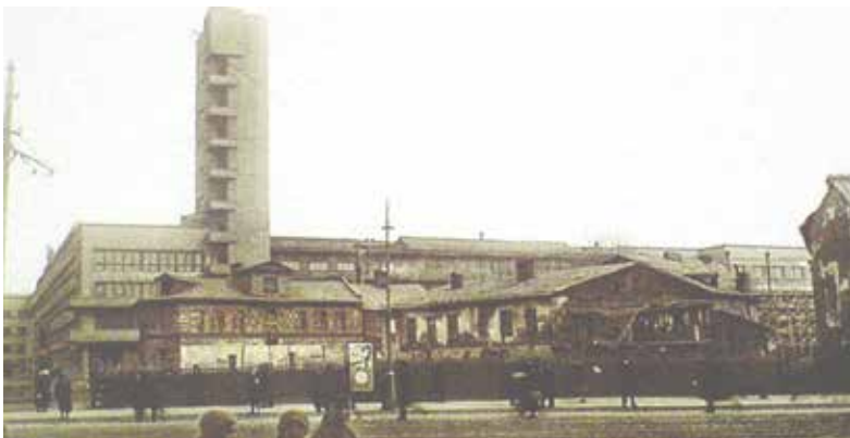
Здание Кировского райсовета, 1935 год. Изначально оно называлось Домом Советов Московско-Нарвского района Ленинграда.