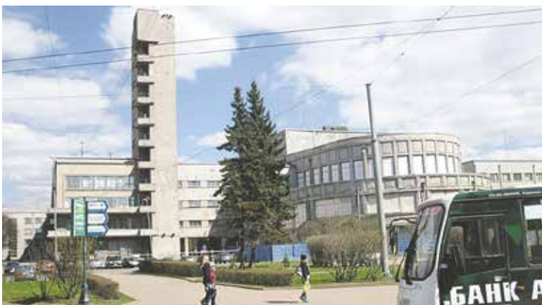
А вот так сегодня выглядит здание администрации Кировского района по пр. Стачек, 18.