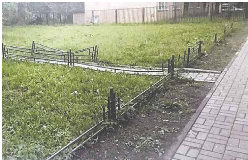
Улица Зины Портновой, 7. Было так...