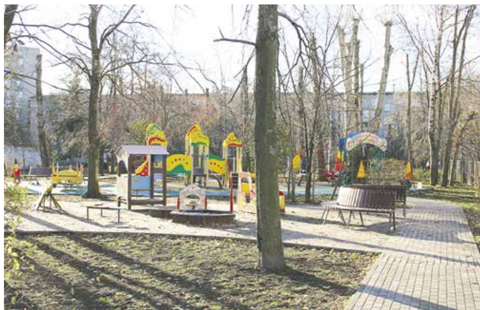
А так стало после комплексного благоустройства.