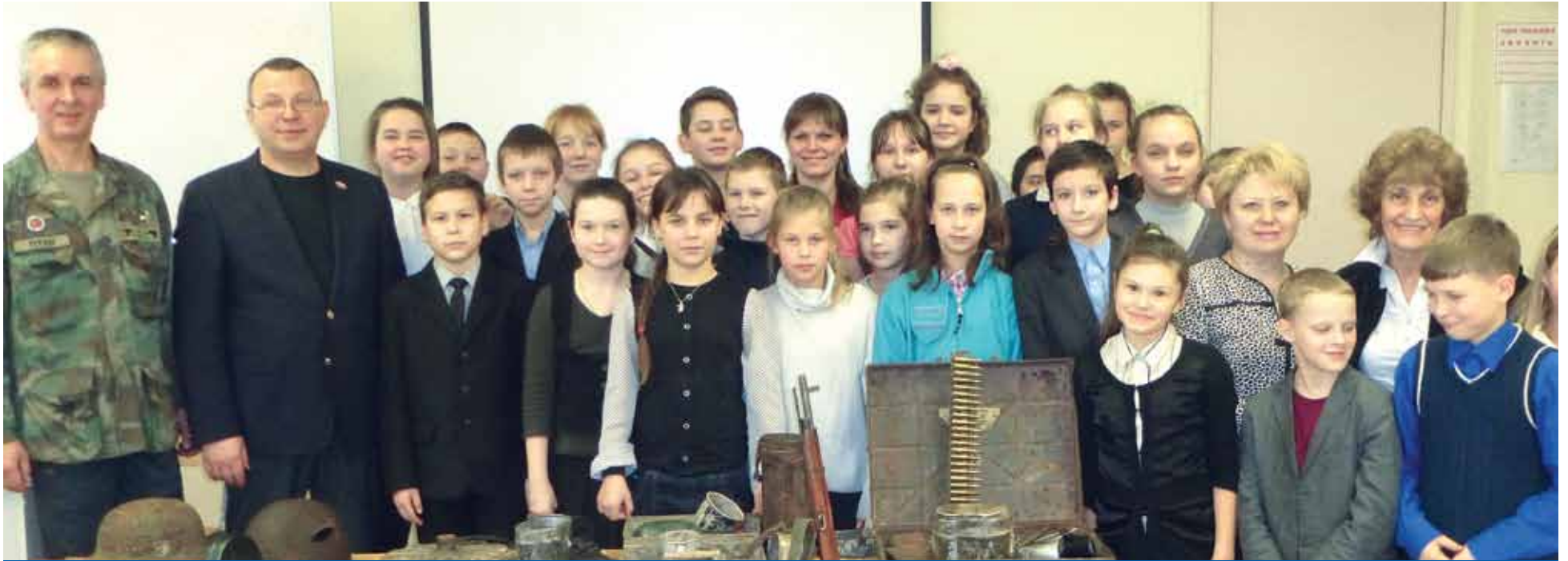
Урок мужества, посвященный 70-летию Победы в 5А классе 247-й школы

Каждый человек, появляющийся в нашей жизни, – учитель. Кто-то учит нас быть сильнее, кто-то учит быть умнее, кто-то осторожнее, кто-то учит прощать, кто-то учит быть счастливым и радоваться каждому дню, а некоторые, вроде, и не учат ничему, а просто ломают все наши стереотипы своим примером, тем самым давая нам ценный урок.