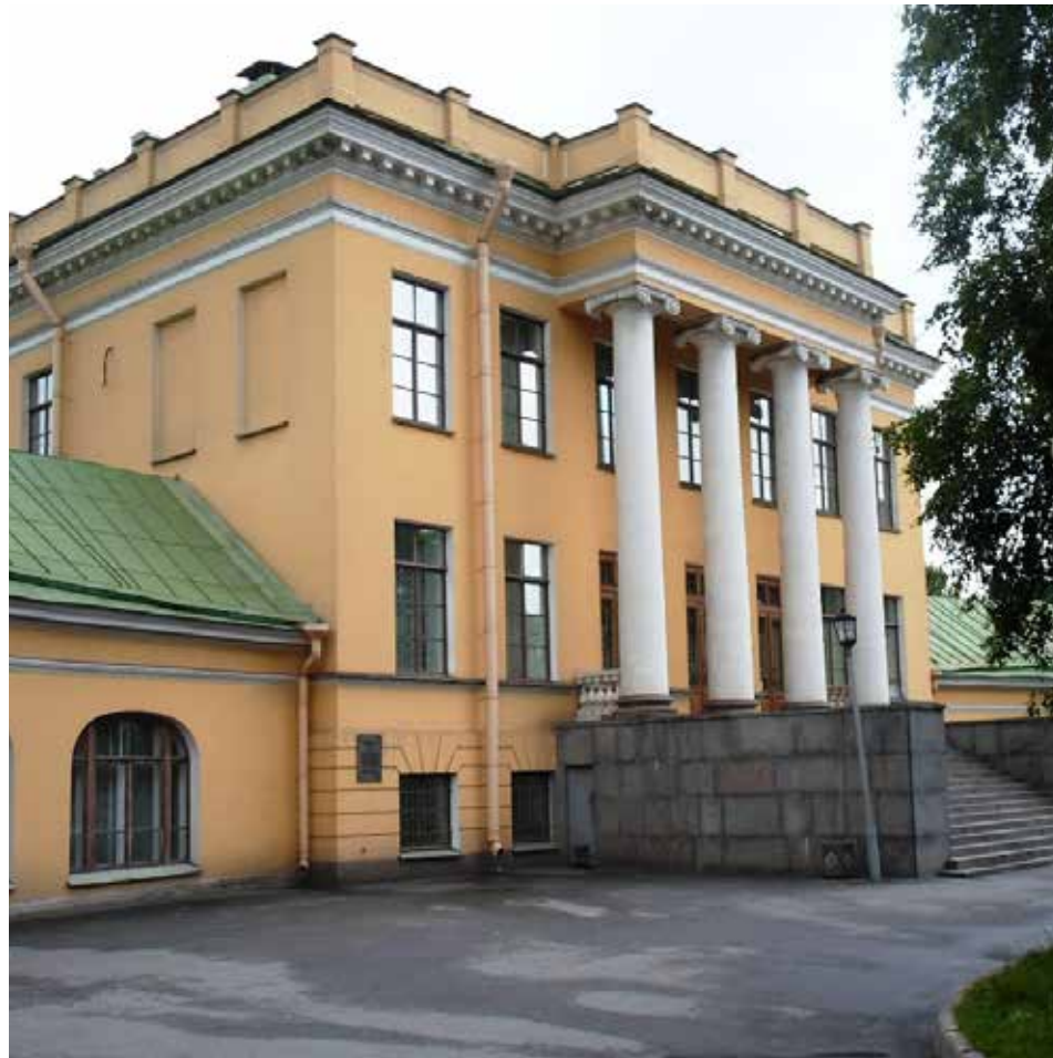
Усадьба Кирьяново. 2017 год

При наследнике Екатерины Павле I Екатерина Романовна оказалась в опале и покинула Петербург и Кирьяново. После ее кончины в 1810 году владельцем