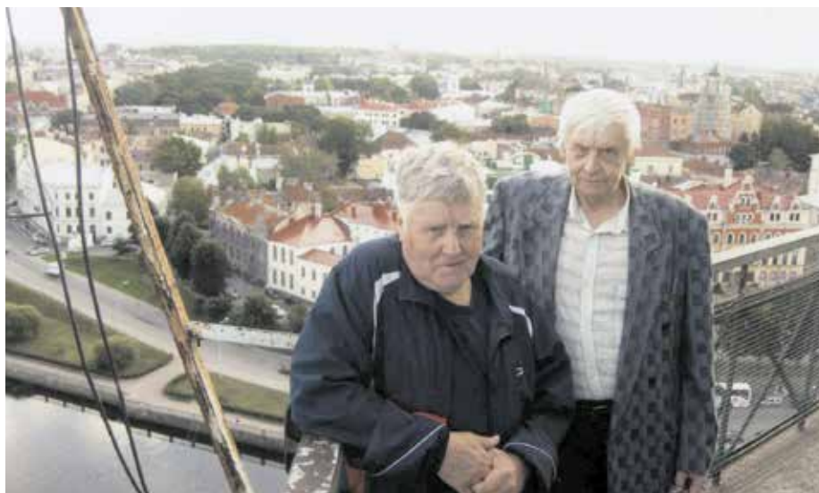
Выборгский замок. Башня Святого Олафа, высота 48,6 метра

Итак, мы въезжаем в Выборг и останавливаемся на рыночной площади. Рядом с нашим автобусом стоят два финских туристических автобуса и две легковушки с финскими номерами. Выборг расположен на северо-западе Карельского перешейка, на берегу Финского залива. Город привлекает большое количество туристов живописными окрестностями, архитектурными памятниками, древними оборонительными сооружениями. Выборг находится в приграничной зоне на пути авто-